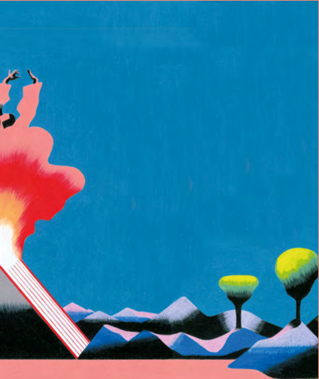
illustrazione © antonio pronostico